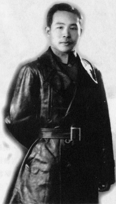
1941年詩人阿壠的肖像

胡風生於1902年，原名張光人，是一位性情耿直的文藝理論家、詩人和翻譯家。他因在三、四十年代創辦了左翼雜誌《七月》和《希望》以及一系列叢書而蜚聲文壇，成為獨立於各黨派以外的知識分子代表，並被視為「魯迅精神」的繼承人。魯迅視胡風為朋友，一個「鯁直，易於招怨」的朋友，當這個朋友遭到「國防派」的攻擊時，魯迅毫不留情地加以反擊：「任意誣我的朋友為『內奸』，為『卑劣』者，我是要加以辯證的，這不僅